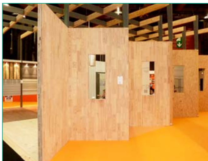
Panneaux contrecollés structurels massifs en Pin Maritime Procédé ABOVE.