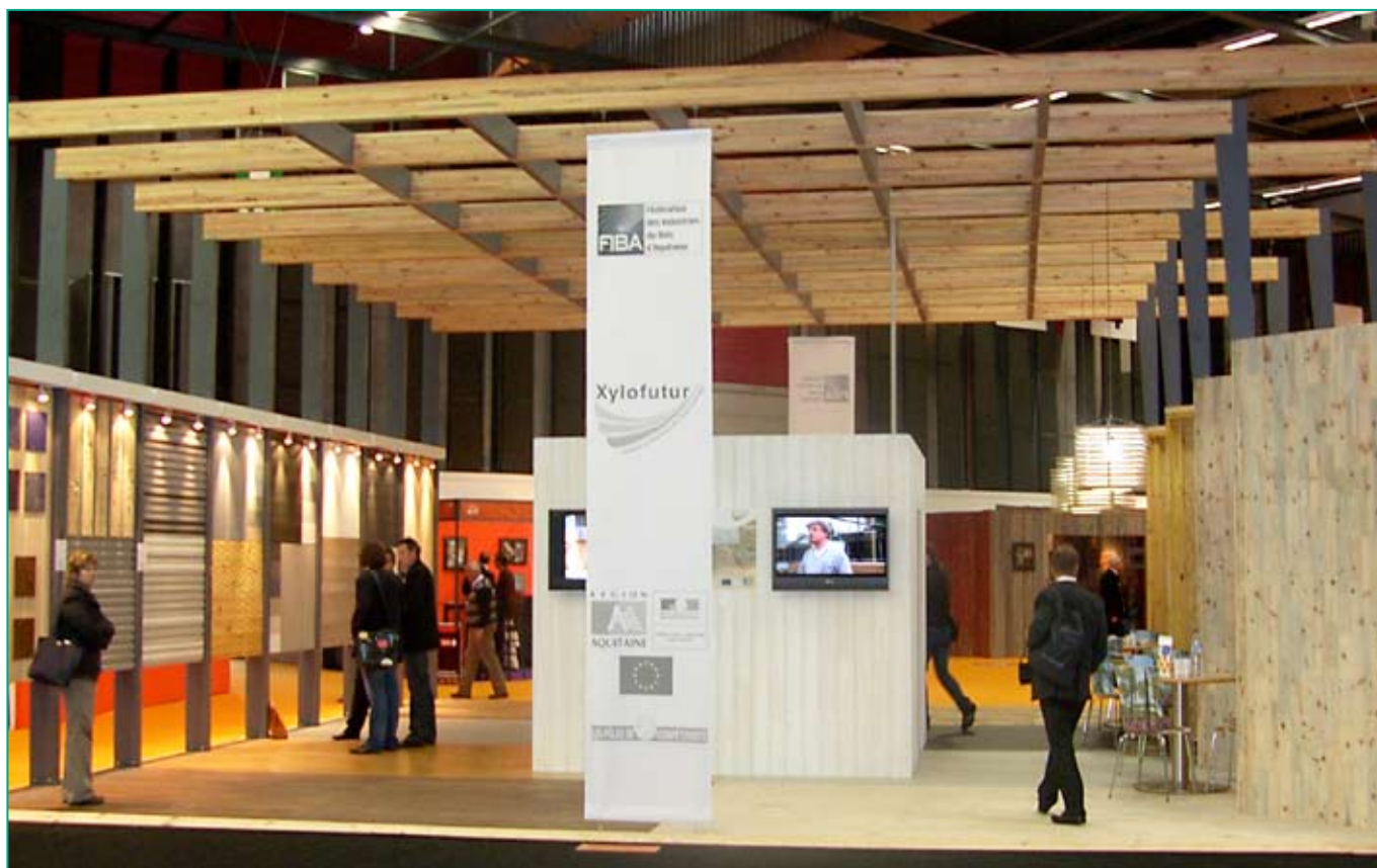
Panneaux de présentation de revêtements intérieurs