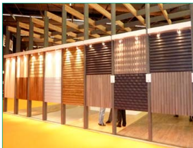
Perspective sur les panneaux de présentation de revêtements extérieurs