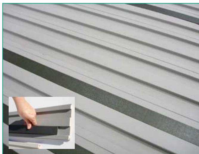
Bardage intérieur « Lambris Relief »