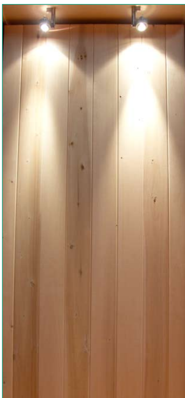
Bardage extérieur en châtaigner exposé sur le Stand Xylofutur – FIBA