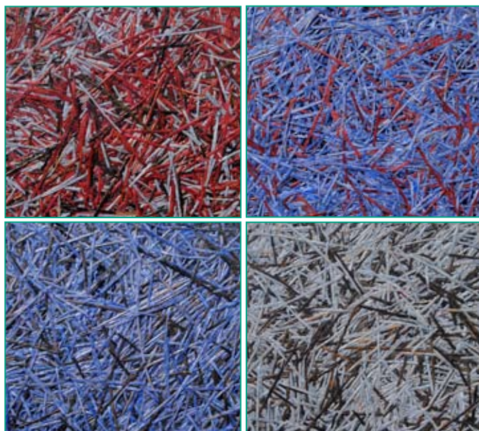
Aiguilles de pin colorées et agglomérées