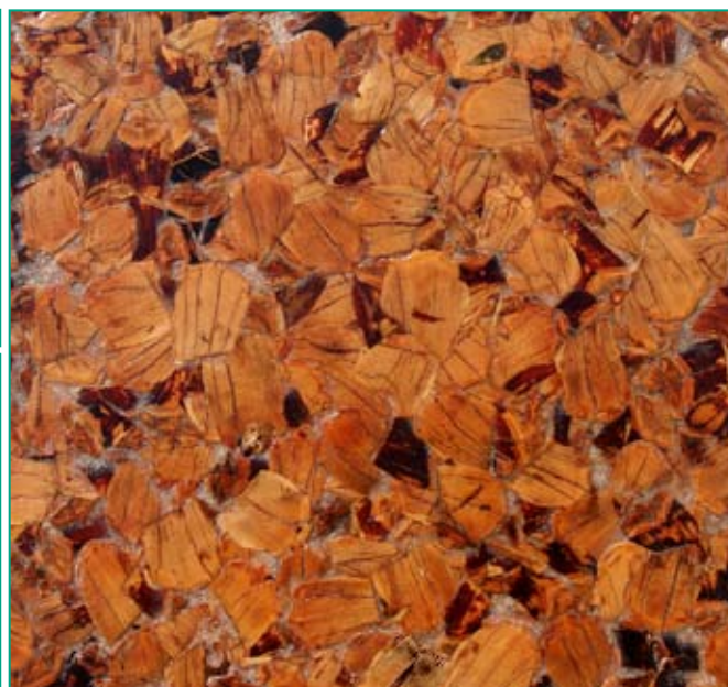
Pignes de pin agglomérées