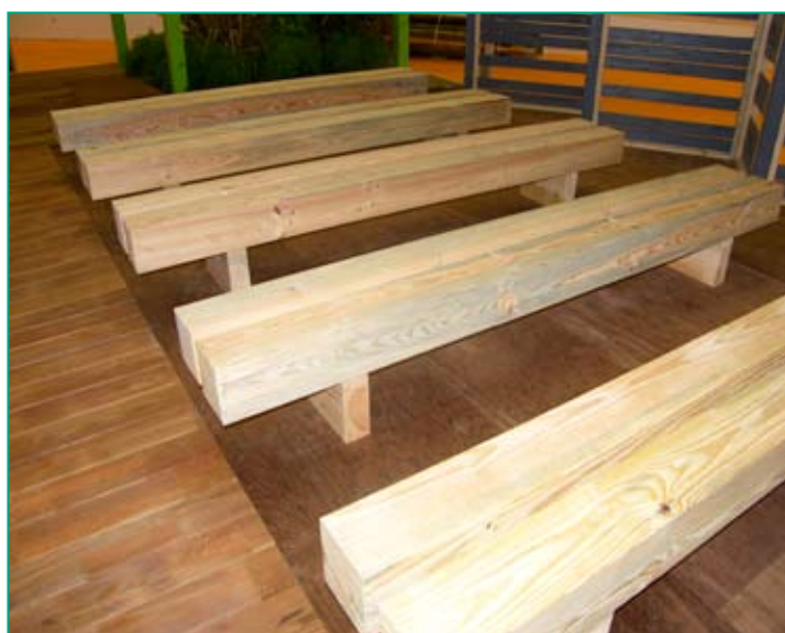
Bancs du forum Vivons Bois réalisés en pin maritime (et intégrant du bois bleu de tempête)