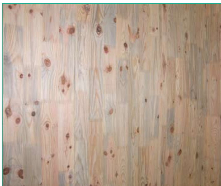
Vue intérieure du Mur Bois Structurant développé dans le cadre d'Innovapin (face bleue).

Cette année, le stand Xylofutur - FIBA a également évolué avec la présentation de produits en châtaigner et peuplier. La fusion de la FIBA avec le Syndicat des Exploitants Forestiers Scieurs de la Dordogne est à l'origine de la participation des transformateurs de parquets et bardages en châtaignier et de lambris en peuplier.