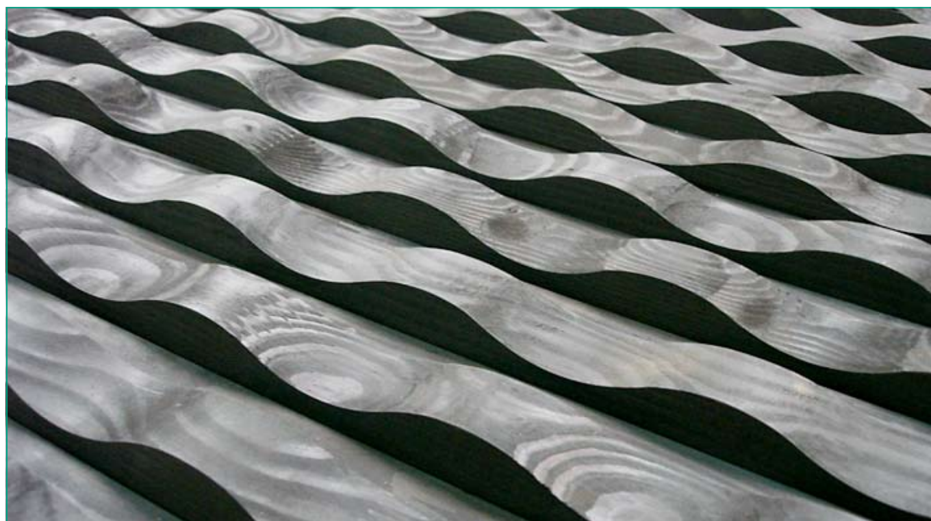
Bardage abouté ondulé en grande longueur Procédé ABOVE Laureat du prix spécial PIN MARITIME TADI 2010 (Trophée Aquitain du Design Industriel. Conseil Régional Aquitaine)